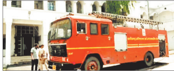
आग बुझाने के दौरान दमकल की टीम।