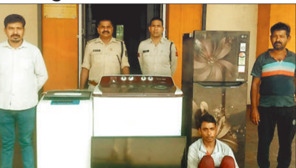
पुलिस गिरफ्त में आरोपी व जप्त सामान।