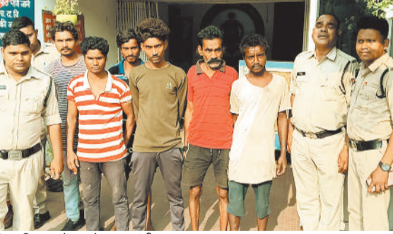
पुलिस गिरफ्त में पकड़े गए वारंटी।

खास बात ■ 37 साल व 32 साल से फरार वारंटियों को भी विशेष अभियान के तहत पकड़ा गया