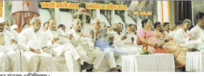
कार्यक्रम में उपस्थित मंत्रय अतिथिगण।

स्व. बिसाहूदास महंत न सिर्फ बांगो बांध बल्कि पृथक छत्तीसगढ़ राज्य के भी स्वप्नदृष्ट थे। वे सही मायने में गांधीवादी, मानवता के पुजारी थे। उन्होंने राजनीति में गुरु, बड़े भाई और मार्गदर्शक की भूमिका निभाते हुए सभी का मार्गदर्शन किया। आज उनके पदिचन्हों पर चलकर हम सभी छत्तीसगढ़ की जनता की सेवा कर रहे हैं। उक्त बातें स्व. बिसाहूदास महंत की 100वीं जयंती शताब्दी समारोह के अवसर पर नेता प्रतिपक्ष डॉ चरणदास महंत ने राजीव गांधी आडिटीरियम टीपी नगर में आयोजित कार्यक्रम के दौरान कही। उन्होंने कहा कि महंत परिवार जांजगीर, कोरबा व छग का सदैव ऋणी रहेगा। कोरबा लोकसभा की सांसद श्रीमती ज्योत्सना चरणदास महंत ने कहा कि बाबूजी के पदिचन्हों पर