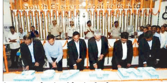
केक काटकर खुशी मनाते एसईसीएल के अधिकारी।

वित्तीय वर्ष 2023-24 एसईसीएल के लिए ऐतिहासिक नतीजे लेकर आया। कंपनी ने 187 मिलियन टन कोयले का उत्पादन किया जो कि स्थापना से किसी भी एक वर्ष का सर्वाधिक उत्पादन है। एसईसीएल ने वार्षिक आधार पर लगातार दूसरे वर्ष 20 मिलियन टन से अधिक की बढ़ोतरी दर्ज की है। गत वित्तीय वर्ष में एसईसीएल ने 180.5 मिलियन टन कोयला उपभोक्ताओं को प्रेषित किया जिसमें सर्वाधिक 147.8 मिलियन टन कोयला देश के विद्युत संयंत्रों को भेजा गया, यह किसी एक वर्ष में कंपनी द्वारा पावर सेक्टर को दिया गया सर्वाधिक डिमैच है। ओल्डर बर्डन रिमूवल (ओबीआर) में पंजीयन टन के ऐतिहासिक परिणाम दिए व 22 प्रतिशत से अधिक की वृद्धि के साथ 323.2 मिलियन क्यूबिक मीटर ओबीआर निष्कासित किया।