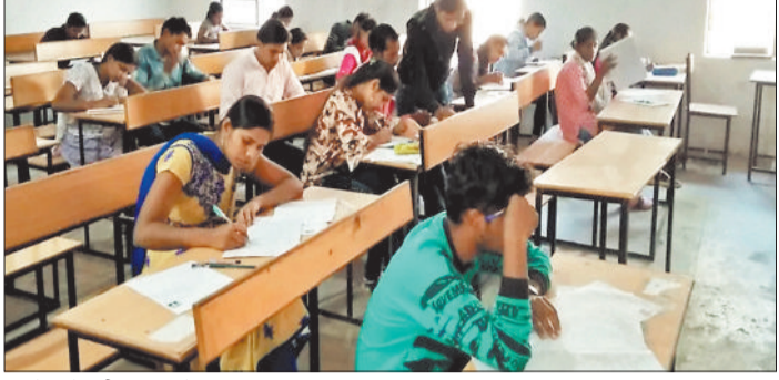
कॉलेज में परीक्षा दिलाते छात्र छात्राएं।

बीते 12 मार्च से महाविद्यालयीय परीक्षाओं का दौर शुरू हुआ है और महज 18 दिन में 9 नकल प्रकरण उड़नदस्ता दल ने तैयार किए हैं। इनमें शहरी क्षेत्र में संचालित महाविद्यालय के साथ ग्रामीण क्षेत्रों में संचालित कॉलेज भी शामिल हैं। कॉलेजों में परीक्षा के दौरान अनुचित सामग्रियों का उपयोग पर रोक लगाने के लिए विश्वविद्यालय प्रबंधन द्वारा कड़े निर्देश दिए गए हैं। किसी भी सूरत में नकल नहीं चलने देने के निर्देश के बावजूद महाविद्यालयीय परीक्षा में नकल प्रकरण तैयार हो रहे हैं और