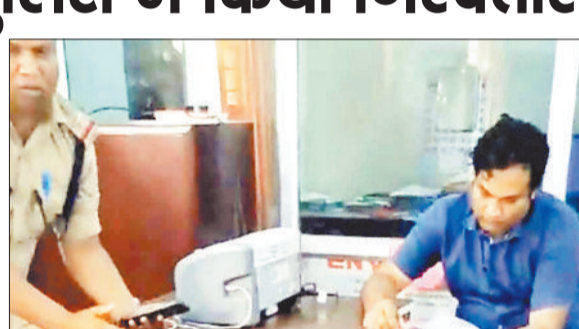
पुलिस गिरफ्त में युवक।